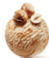
Lešnik - 160

Sladoled od posebne vrste lešnika iz regije Piemonte U Italiji