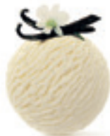
Vanila Madagaskar - 160

Sladoled od posebne vrste lešnika iz regije Piemonte U Italiji