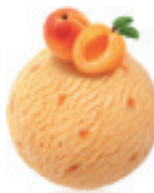
Jogurt kajsija - 160

Vaniia iz oblasti Madagaskar. Tradicionaini ukus jaceg intenziteta