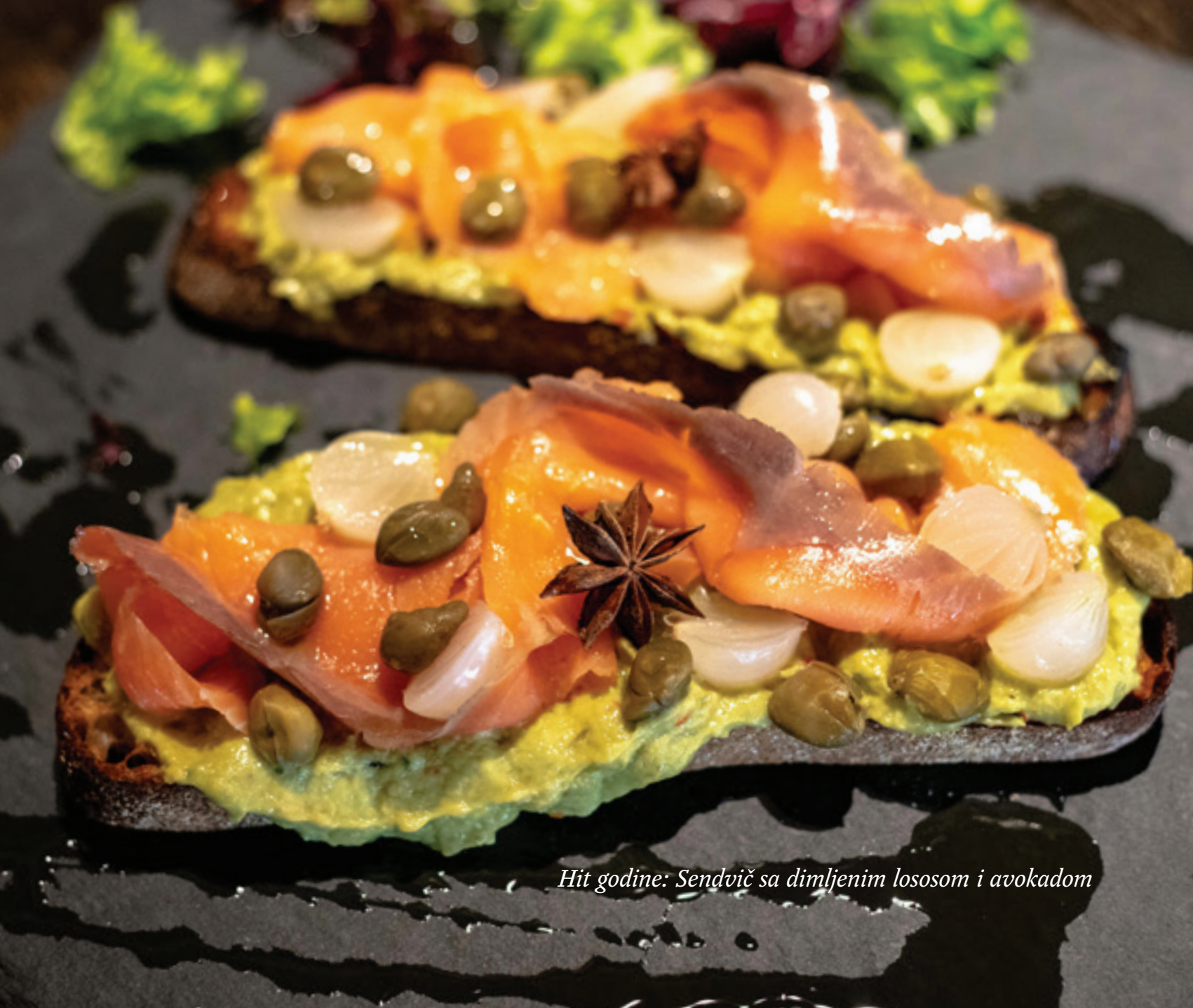
Hit godine: Sendvič sa dimljenim lososom i avokadom