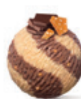
Slana karamela - 160