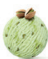
Pistać 100% - 160

Najfiniji kokos sa belom čokoladom i hrskavim vaflom