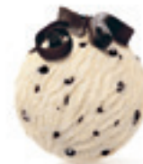
Straccatella - 160

Kombinacija ruma i suvog grožđa za one sa najistančanim ukusom