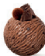
Čokolada - 160

Za najzahtevnije sladokusce, pečeni pistać 100%