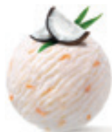
Raffaello - 160

Sladoled mlečnog ukusa sa prelivom od hrskave crne čokolade