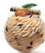
Malaga - 160

Kombinacija ruma i suvog grožđa za one sa najistančanim ukusom