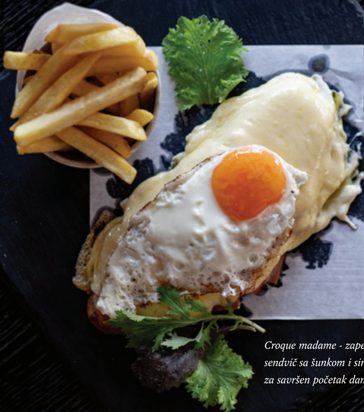
Croque madame - zapečeni sendvič sa šunkom i sirom za savršen početak dana