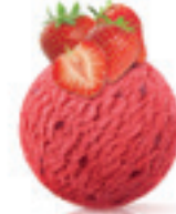
Jagoda - 160

Veliki procenat bobicastog savršenstva, bez mleka